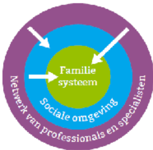
Figuur 2.1 Familiesysteem (bron: Veilig Thuis – Rotterdamse aanpak – 2014)

Op de gemeente rust de verantwoordelijkheid om er voor te zorgen dat er deskundig hulp- en zorgaanbod in de multidisciplinaire teams beschikbaar en direct inzetbaar is. De inspanning van de gemeenten is er dan ook op gericht om wachtlijsten te voorkomen of terug te dringen.